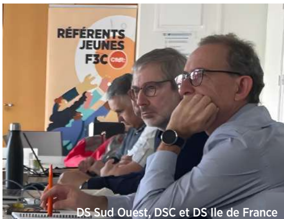
DS Sud Ouest, DSC et DS Ile de France